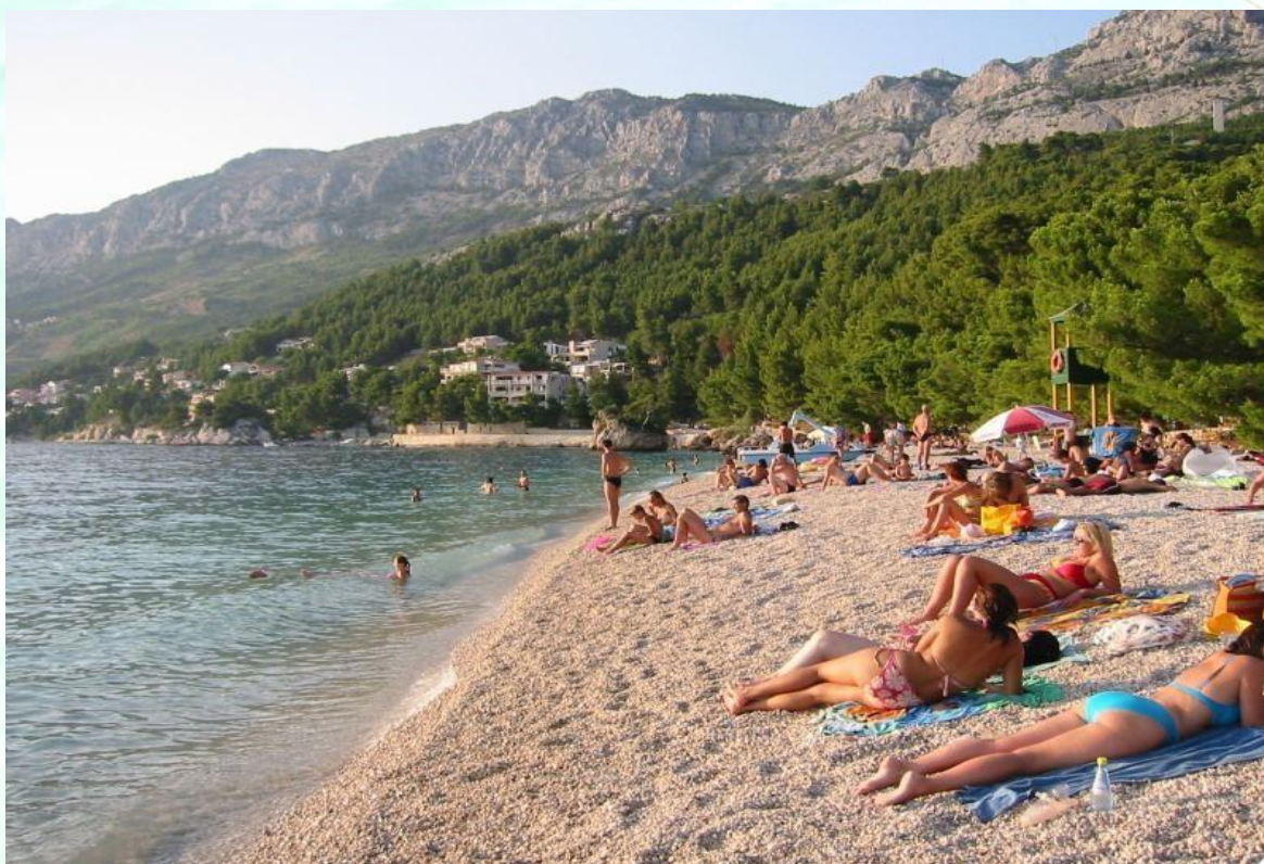
Popoldansko sonce na prodnati plaži z gorovjem Biokovo v ozadju