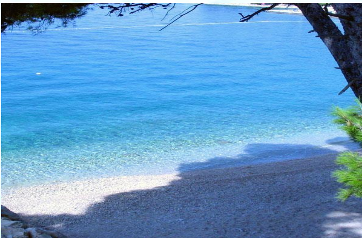
Slika prodnate plaže, slikano ob 9. uri zjutraj, ko so barve morja čarobne