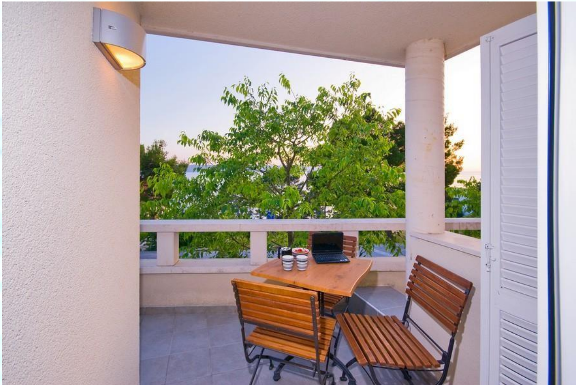
Pogled iz balkona apartmaja za 2-3 osebe proti plaži in morju