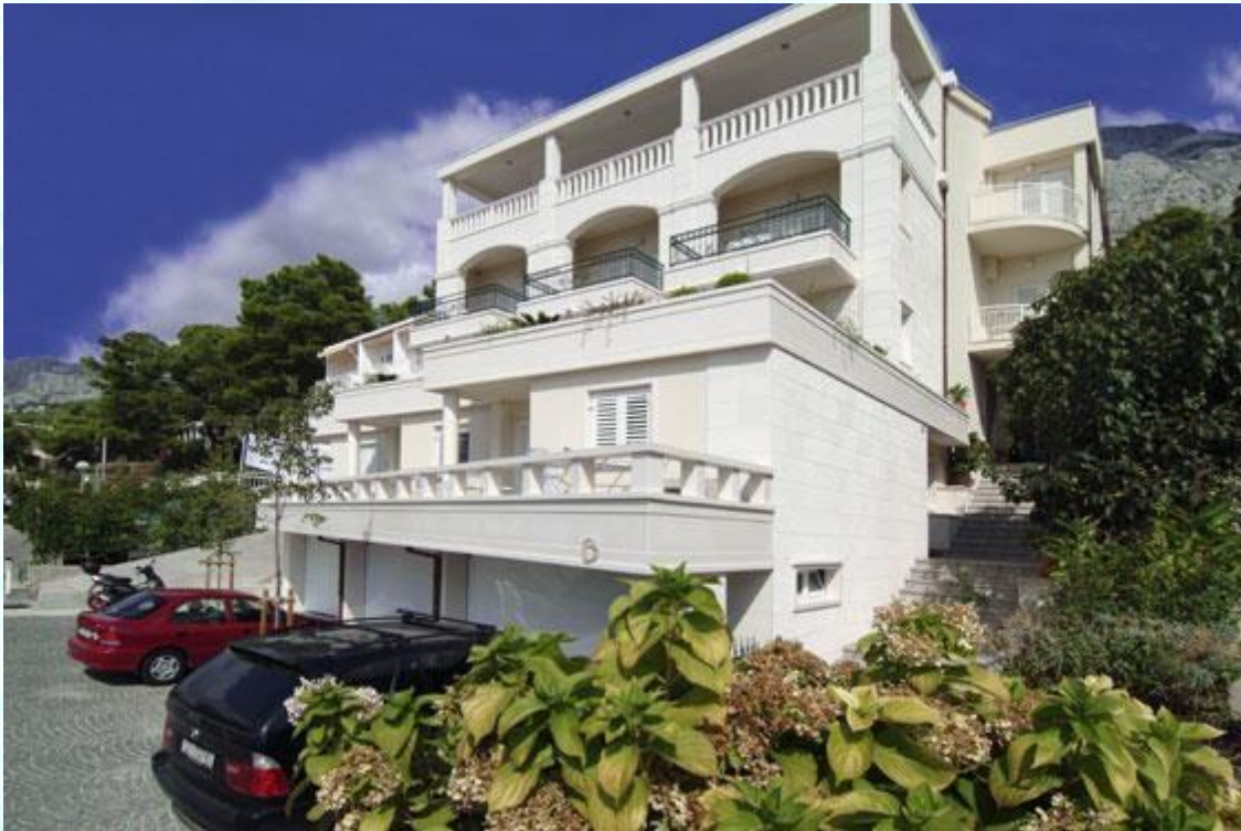
Nova hiša s 3 nadstropji – spodnji balkoni nad garažo so od majhnih apartmajev 2+1