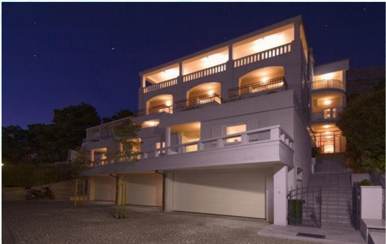
Balkon od studio apartmaja je takoj nad garažami – visoko pritličje