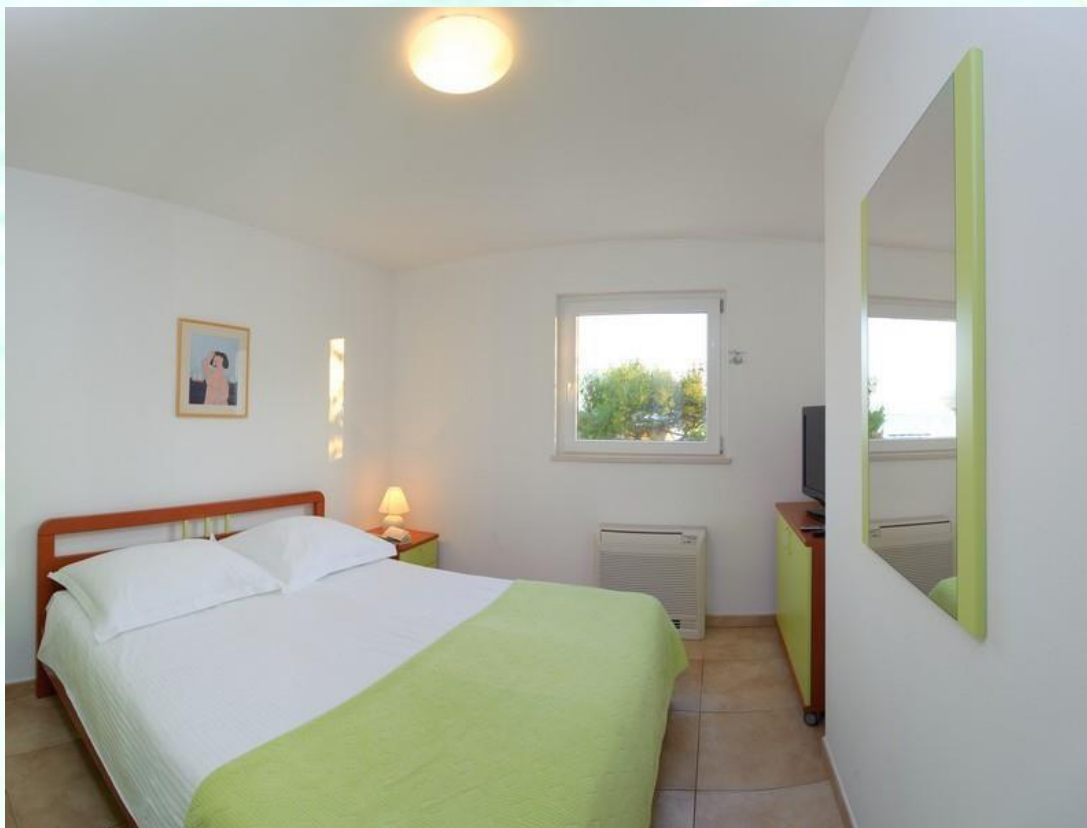
Z vrati ločena spalnica v apartmaju za 2-3 osebe