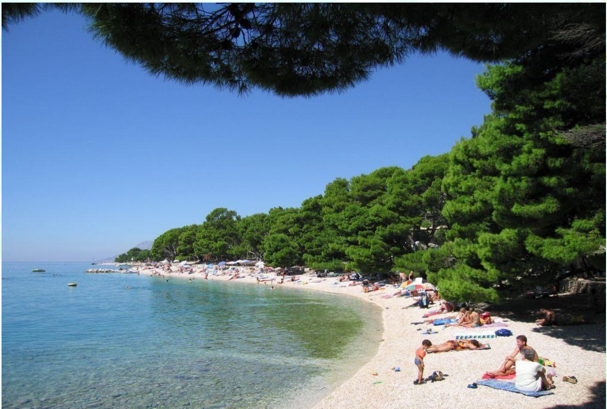
Plaža v Breli je bila leta 2005 objavljena na seznamu top 10 plaž sveta (Lonely Planet)