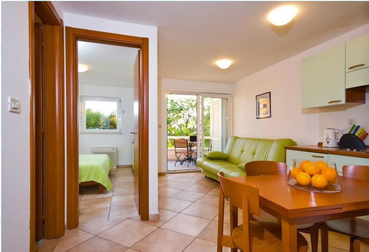
Raztegljiv kavč se raztegne v 140 x 200 cm veliko ležišče; kuhinjski kotiček in izhod na balkon