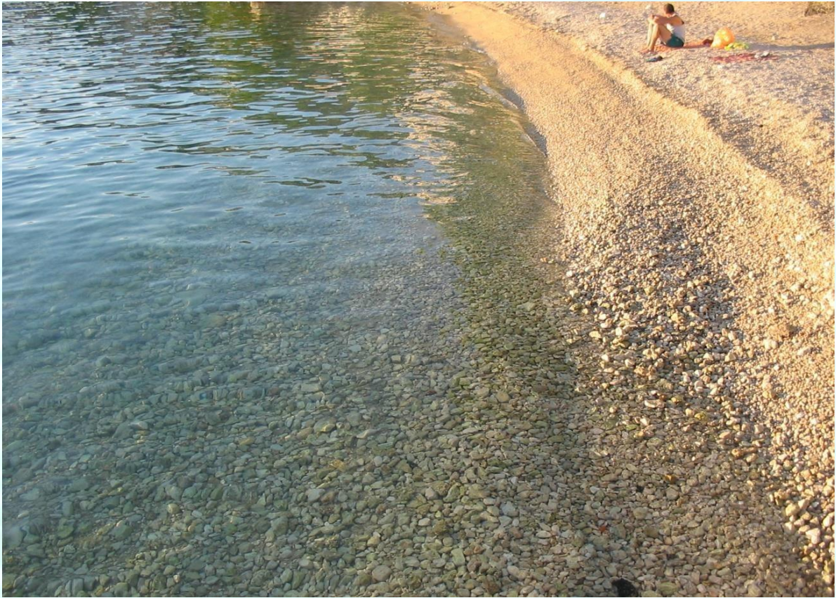
Otroci uživajo v obilju kamenčkov znamenite plaže Makarske riviere