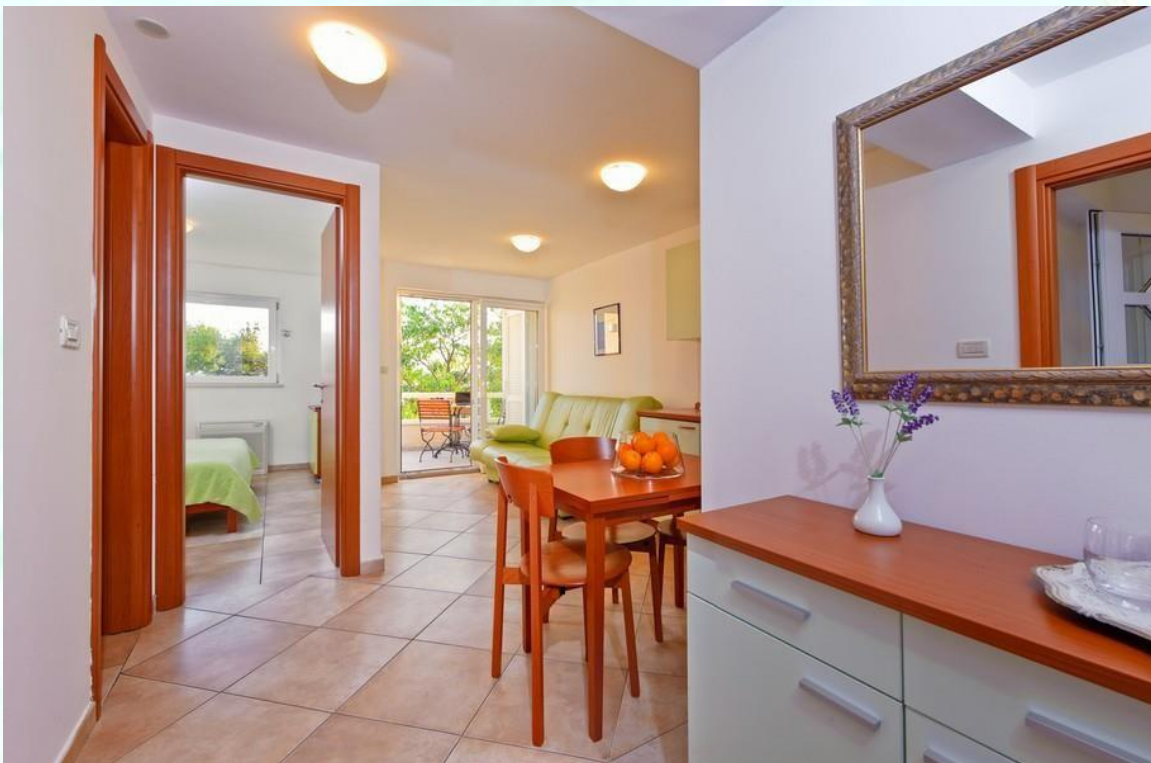
Apartma z 1 ločeno spalnico, kuhinjskim kotičkom in izhodom na balkon