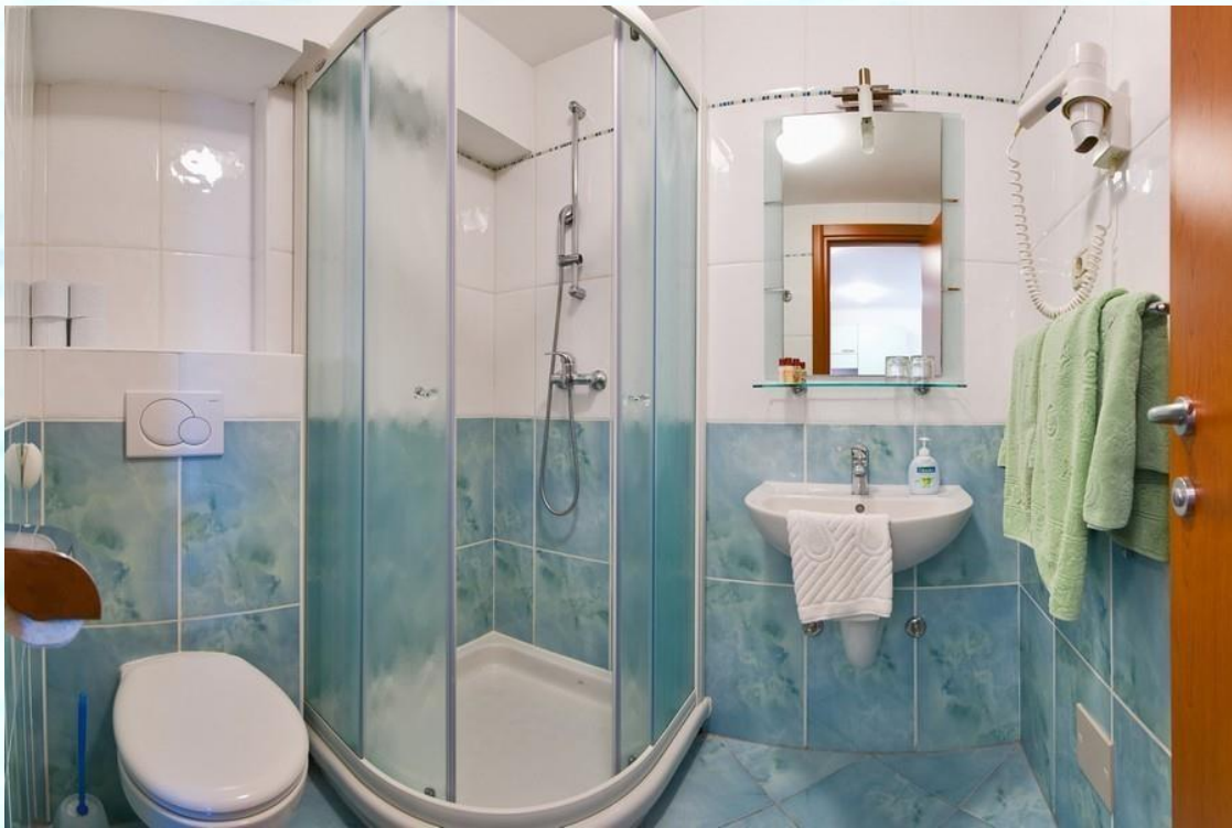
Kopalnice so v vseh apartmajih enake (WC in tuš kabina), le v različnih barvah