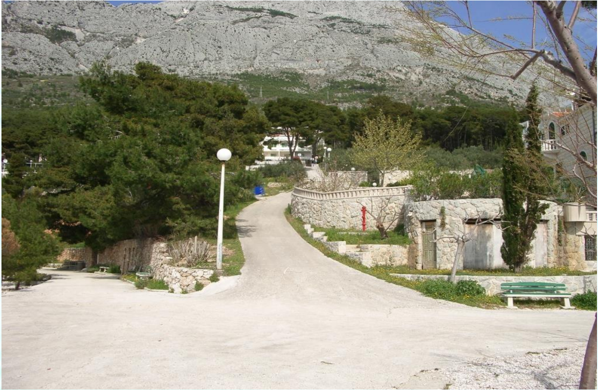
Pot v klanec, ki vodi iz plaže do apartmajev (skupaj 140 m)