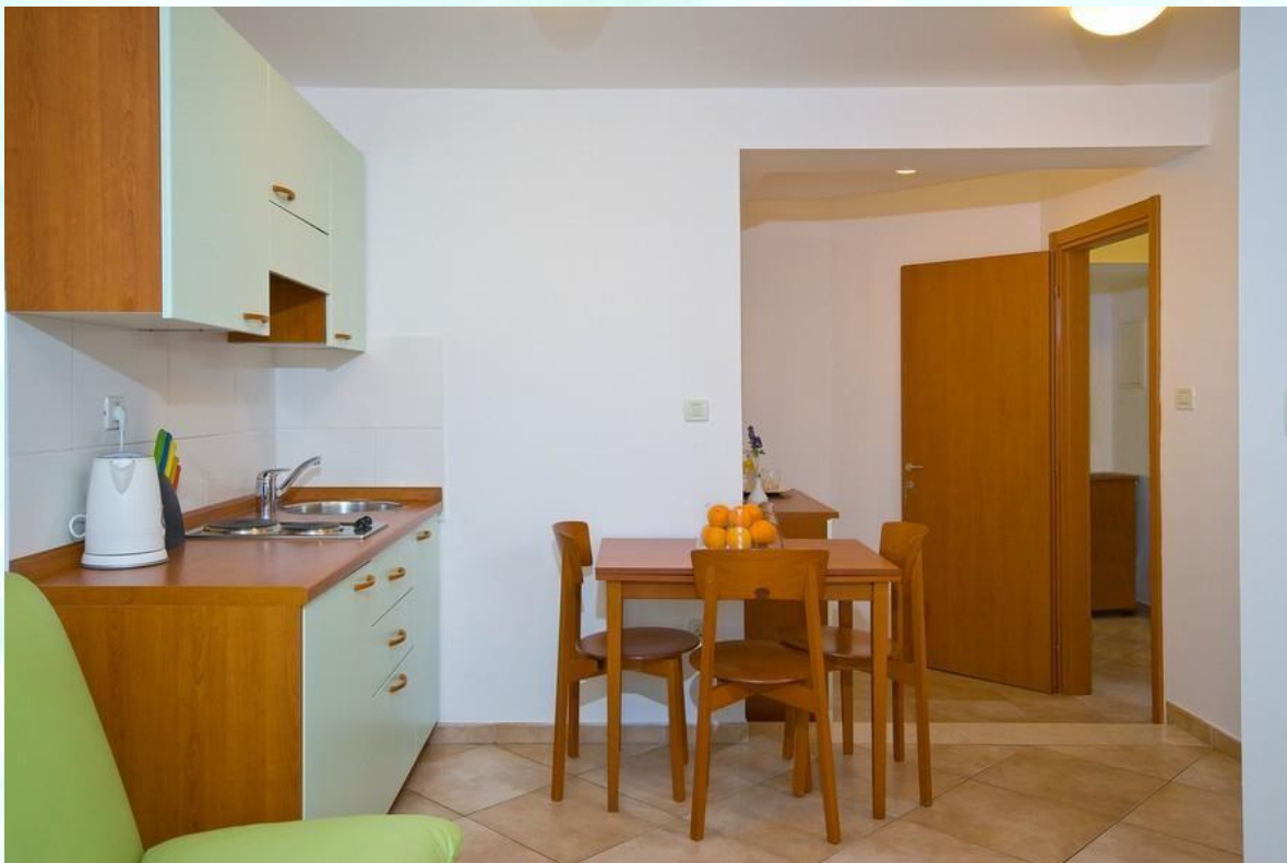
Vhod v apartma