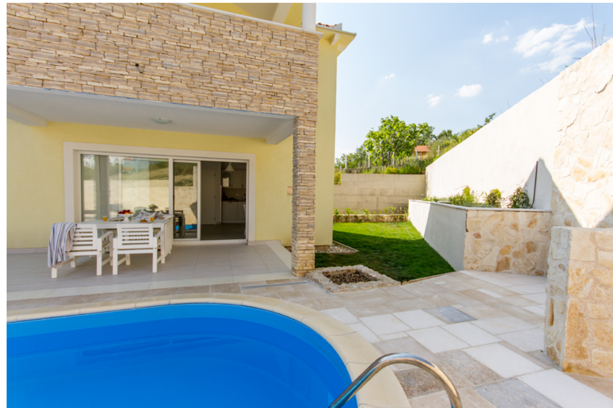
Blizu in pred hišo je lep vrt z mehko travo, kjer se lahko igrajo otroci