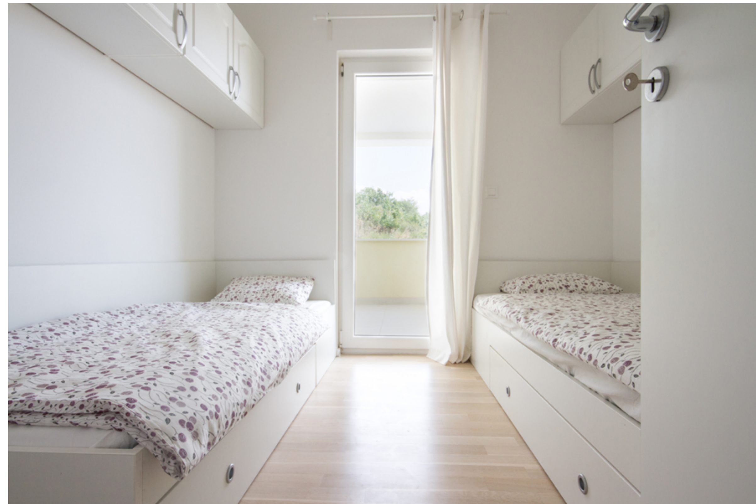
Druga spalnica z dvema ločenima posteljama za 2 otroke ali odrasla in izhod na balkon