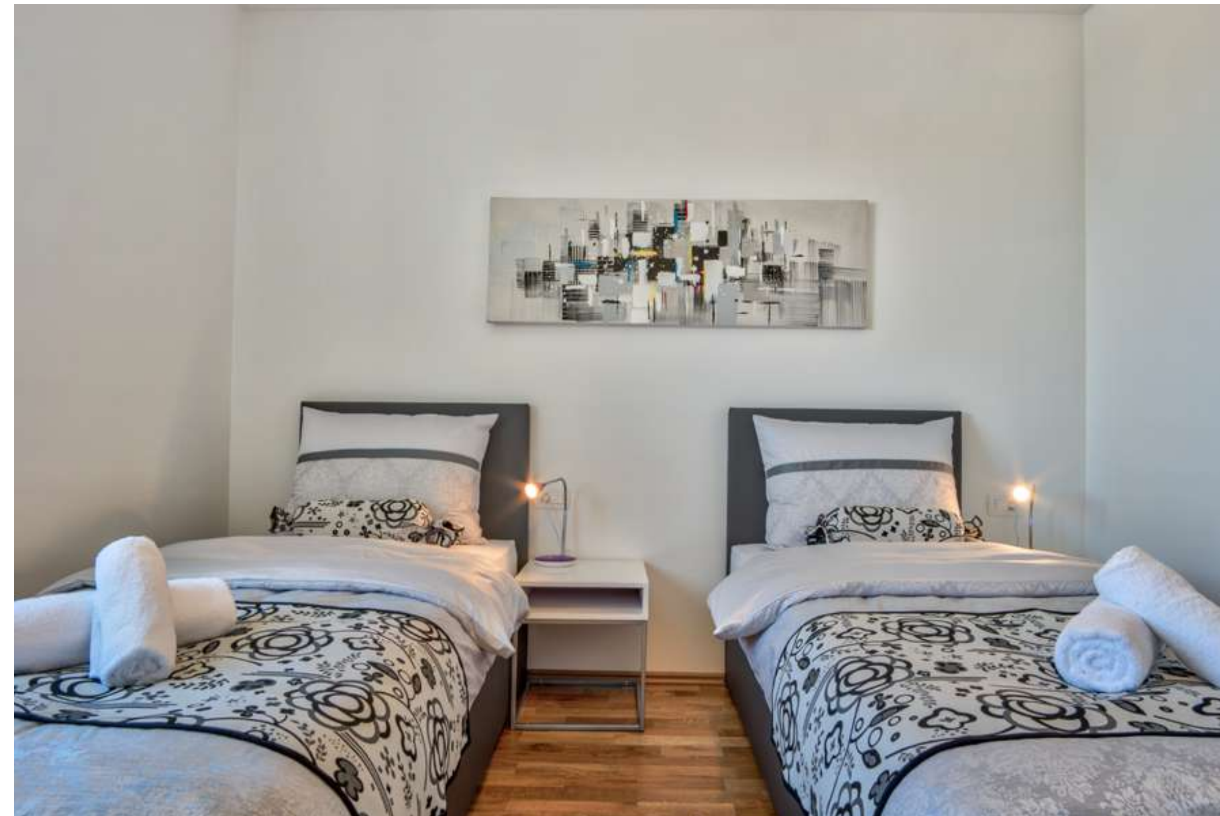
Tretja spalnica z dvema ločenima spalnicama