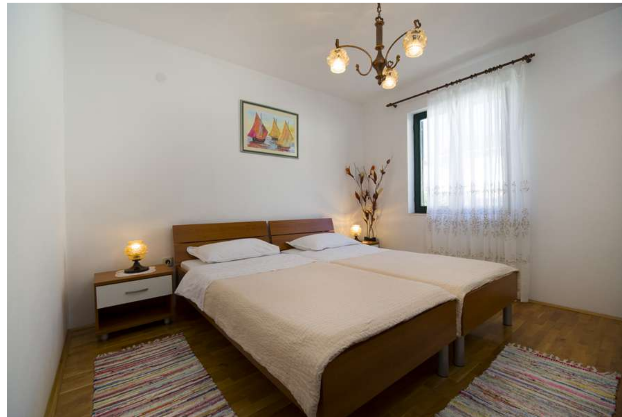
Tretja spalnica ima dve ločeni postelji, ki pa se lahko spremenita v eno samo