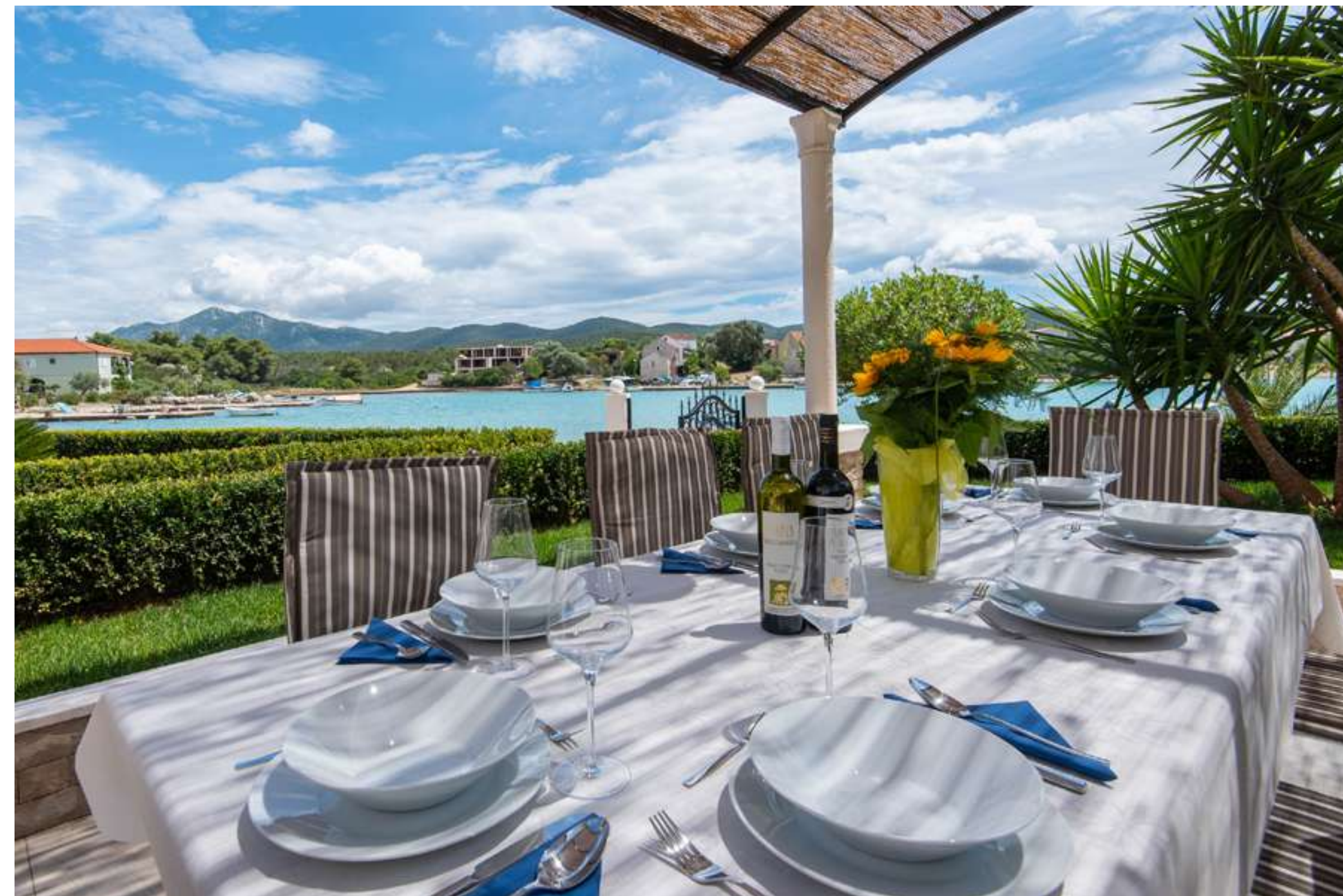
Tukaj lahko uživate jutranjo kavo ali pa si privoščite slastno večerjo!