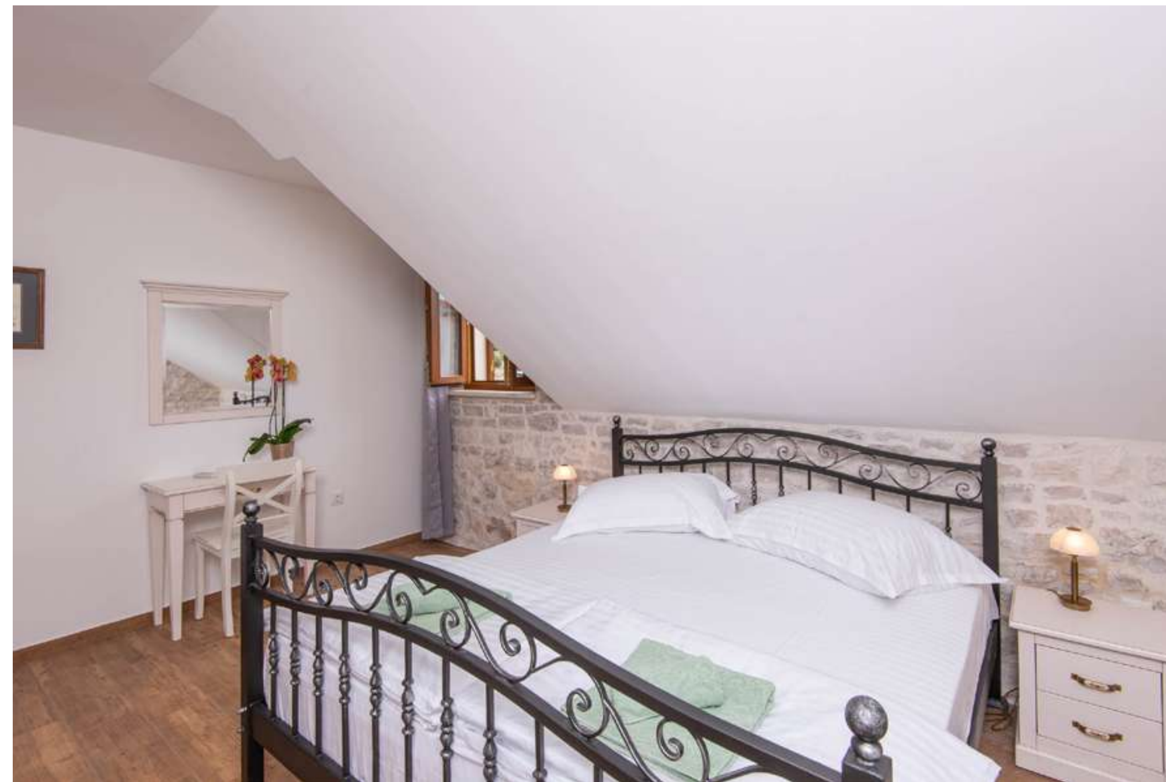
Druga spalnica z romantičnimi detajli